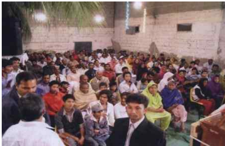
Все още може да наемаме зали.