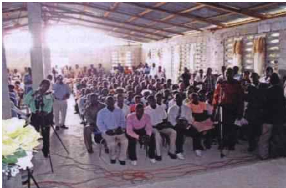
Частичен изглед на събрание в Порт-о-Пренс, Хаити на 14 март 2010 година.

Тази анти Божията троица - големия дракон, антихристът и лъжепророкът - те носят трикратно така числото 666. Също още се добавя и това, че цифрата 6 е число на враждата срещу Бога. Тройна 6 (666) въплъщава така най-високата точка на човешката вражда срещу Бога. Числото 6 е на гръцки означава «стигма», т.е. «белег» (знакът). То, че тези те три опознавателни знаци появяват се паралелно една на друга именно в последното ни време, но също повече и Вавилон (Отк.17) пак реално се появява на плана като противникът на Ерусалим, бива да ни даде тласъка за прислушване.