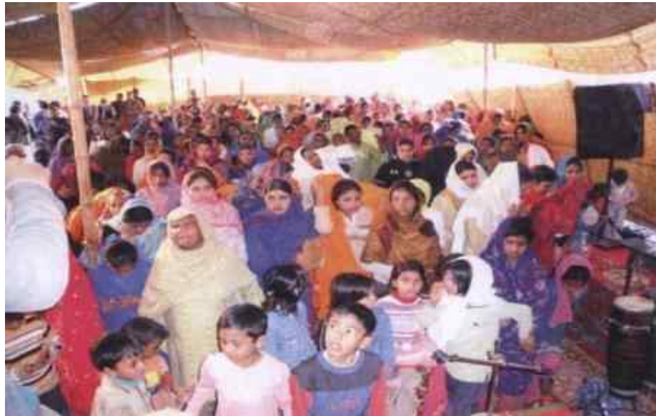
В края всичките изправя да посветят живота си на Бога.